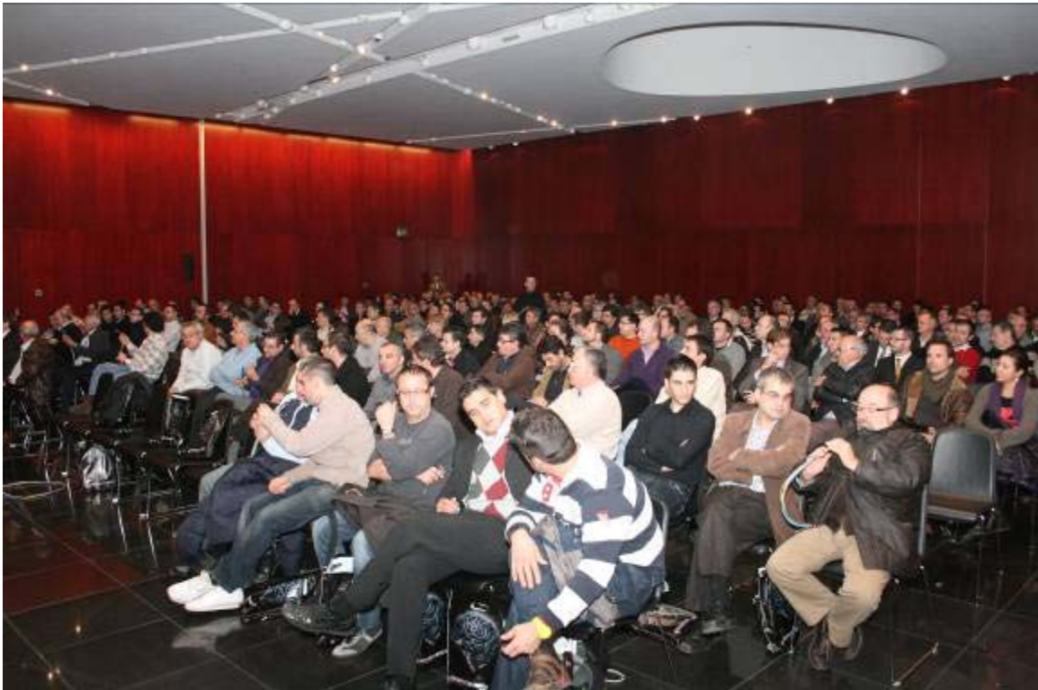
Detalle de la 2ª Jornada en el Hotel Porta Fira de Barcelona

Prysmian ha desarrollado un exitoso plan de presentaciones entre los pasados meses de Septiembre y Diciembre dando a conocer el nuevo cable Afumex Duo en las principales capitales de provincia del país, y que es fruto de los resultados del esfuerzo innovador de Prysmian. Más de 1.500 profesionales del sector, entre Ingenieros, Instaladores, Arquitectos y Distribuidores han asistido a estas jornadas de formación.