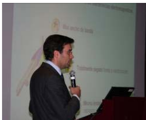
Dos momentos de la presentación de las Jornadas en Valencia y Barcelona respectivamente.

El Grupo Prysmian en España engloba todas las actividades de diseño, fabricación, venta, posventa y servicios relacionados con los cables y accesorios para cables de Energía y Comunicaciones. El Grupo Prysmian en España cuenta con cinco factorías en Barcelona y gracias a su decidida apuesta por la innovación, lidera el mercado de los cables de energía y comunicaciones en España y en el resto del mundo.